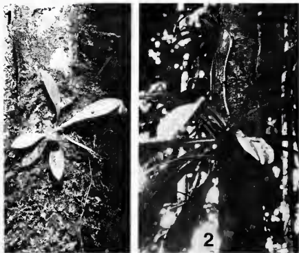
Pl. 2. — Philodendron linnei Kunth : 1, germination sur un tronc, dans le sous-bois, grandeur nature; 2, flagelle apparaissant à l'extrémité apicale de la dernière rosette sympodiale d'un individu dont les feuilles mesurent 30-40 cm; à ce stade les inflorescences ne se développent pas.

le flagelle peut se ramifier. Cette ramification n'apparaît que si l'éclaircissement, au niveau du sol, est important : châblis récent, bords de ruisseaux, bords de chemins, ... La ramification, diffuse, est de deux types :